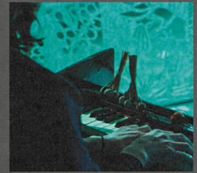
まなざしの森-passage- 2025年